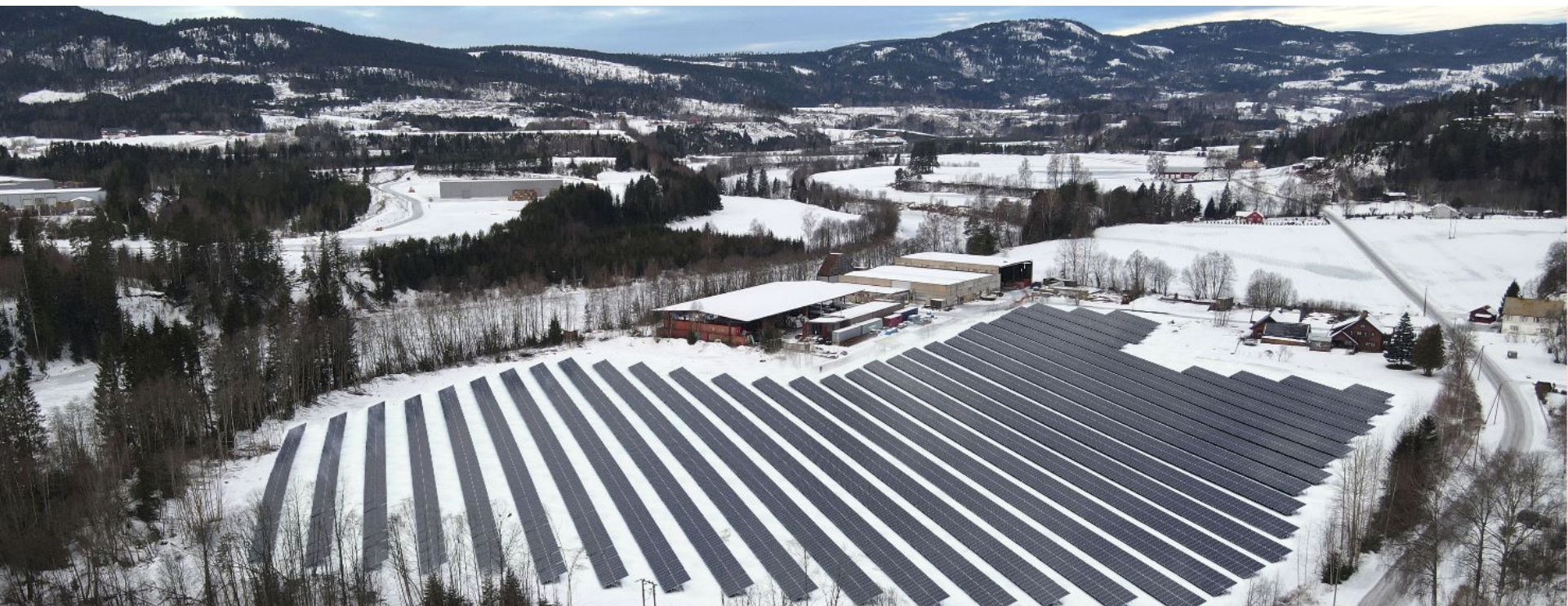
Engene Solkraftverk: 6,1 MWp, 51 mål