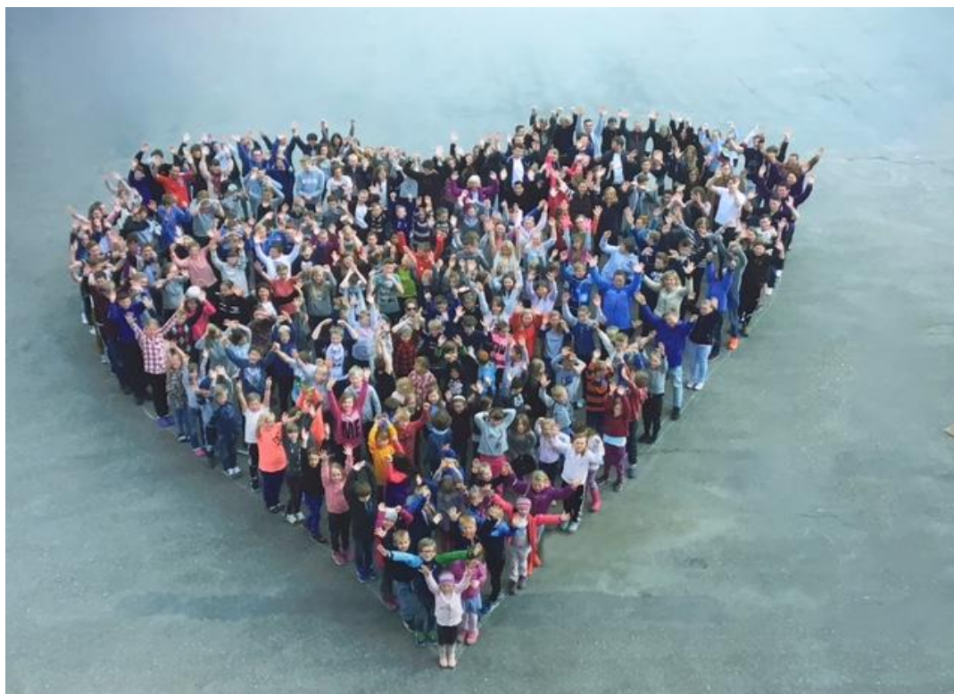
Foto: Kvelde skole VIS-dag mars 2016

I tillegg har ansatte en skjerpet aktivitetsplikt i saker der ansatte krenker elever jf. oppl. § 12-5. Dersom en som jobber på skolen får mistanke om eller kjennskap til at en annen som arbeider på skolen utsetter en elev for krenkelser, skal vedkommende straks varsle rektor. Rektor skal varsle skoleeier på skjema – Melding til skoleeier med mindre meldingen er åpenbart grunnløs.