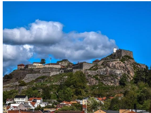
Figur 13: Fredrikstens festning ruver over Halden.

Opera Østfold produserer i all hovedsak utendørsopera på spektakulære Fredrikstens festning med 2.800 seter i Halden annethvert år, men har også mindre arrangementer ellers i året. Scenen må bygges opp hvert år, noe som påvirker kostnadsnivået oppover. Per 2023 har ikke Opera Østfold fått realisert statlig støtte på 70%. Fordelingen har ligget på 46% i statlig støtte og 54% i regional støtte. Dette kan ha å gjøre med at de søker om vesentlig høyere summer enn f.eks. Opera Nordfjord. For 2024