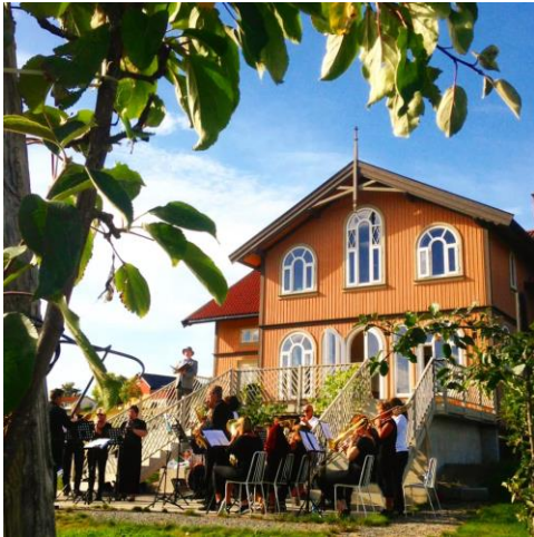
Figur 5: Det yrer av liv ved Villa Lundes mange operaarrangementer i Nome, Telemark.

opplæring, tett samarbeid med frivilligheten og godt kunstnerisk nivå med bredt samarbeid lokalt og nasjonalt. De tilgjengeliggjør opera som kunstform over hele landet og er et viktig springbrett ut i verden for unge aktører innenfor et mangfold av rolleutøvelser innenfor en operaproduksjon. De samarbeider også tett med hverandre. Distriktsopera finnes i Nordfjord, Halden, Oscarsborg, Trøndelag, Kristiansund, Stavanger/Sandnes og Ringsaker.