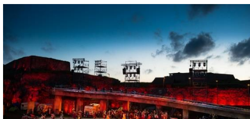
Figur 12: Figur 12: Fra "Den flyvende Hollender" i 2022.

mottar Opera Østfold: ca. kr. 4,1 mill. fra Østfold fylkeskommune, ca. kr. 4,1 mill. fra Halden kommune og ca. kr. 7,1 mill. i statlig støtte, i tillegg til 1 mill. (15%) i statlig støtte spesifikt til arbeid med barn og unge (ref. av operasjef Pål Scott Hagen i Opera Østfold). Halden kommune har 30.132 innbyggere, Østfold fylke har 297.520 innbyggere.