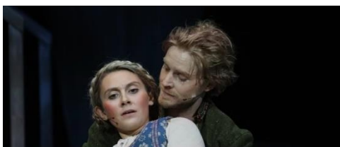
Figur 11: Fra "Soga om Sol" komponert av Gisle Kverndokk fra Skien i forbindelse med Opera Nordfjords 25-års jubileum: Foto: Fjordabladet

Opera Nordfjord feirer 25 år i år, og har blitt et