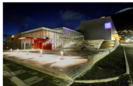
Figur 10: Operahuset i Nordfjord.