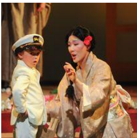
Figur 1: Fra "Madama Butterfly" i Hjertnes i juni 2023.

De senere årene er det Vestfold Symfoniorkester som har arrangert fullskala operaforestillinger i Hjertnes kulturhus. I begynnelsen var dette turnéproduksjoner gjennomført av Den Norske Opera & Ballett som del av riksoperamodellen. Da operaen bygget ned riksoperamodellen og sin turnevirksomhet tok Vestfold Symfoniorkester på seg ansvaret med å videreføre operatilbudet. Fra 2008 og frem til i år, har orkesteret satt opp operaforestillinger hvert andre år, sist i sommer med