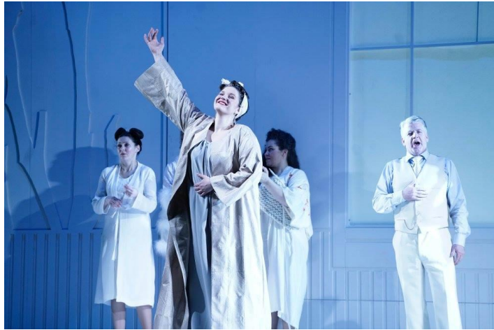
Figur 2: Lise Davidsen debuterer i "Ariadne auf Naxos", Arktisk Filharmonik i 2017.

verdens største operascener som kanskje den mest lysende stjernen av dem alle. Et eksempel på verdien av et lokalt kulturtilbud tidlig i livet.