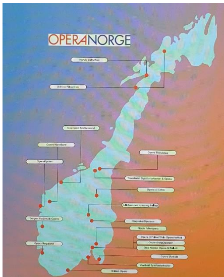
Figur 3: Kart over OperaNorges medlemmer

Første punkt har bestått i å gjøre seg kjent med eksisterende operamiljøer i fylket; ha nær kontakt med OperaNorge, de norske operaprodusentenes nettverk; opprette en arbeidsgruppe for drift av- og innhold i Opera Vestfold og Telemark (OVT).