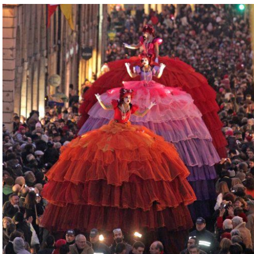
Figur 7: Sprudlende teaterliv i forbindelse med PIT i Porsgrunn.

Det er også viktig å bemerke det rike og varierte teatermiljøet som eksisterer i fylket, med Teater Ibsen i Skien, Grenland Friteater i Porsgrunn og Papirhuset i Tønsberg, for å nevne noen. I tillegg til dette kommer barneteater-grupper. Det samme gjelder dansemiljøet. Opera er scenekunst, og vil nyte godt av nære bånd til et levende og kreativt danse- og teatermiljø.