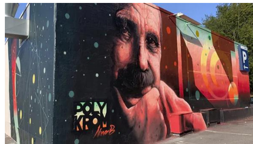
Figur 6: Komponistene Antonio Bibalo og Arne Nordheim er begge æresborgere av Larvik.