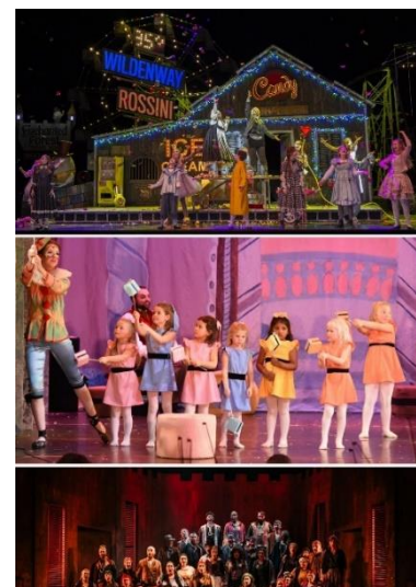
Figur 4: Regions- og distriktsoperaene i OperaNorge er svært forskjellige og tilbyr et bredt spekter av operaprosjekter over hele landet.

Det er syv distriktsoperaer i Norge. I motsetning til regionsoperaene benytter distriktsoperaene en betydelig frivillig innsats og er ikke tilknyttet et profesjonelt orkester. Distriktsoperaene tilbyr gjennom sine operaproduksjoner et levende samarbeid mellom amatører og profesjonelle,