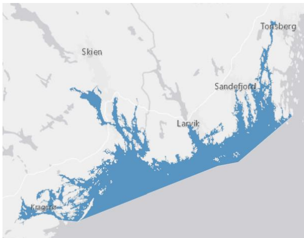
Figur 1. Kystområdene utenfor Larvik er en del av den nasjonale laksefjorden Svennerbassenget.