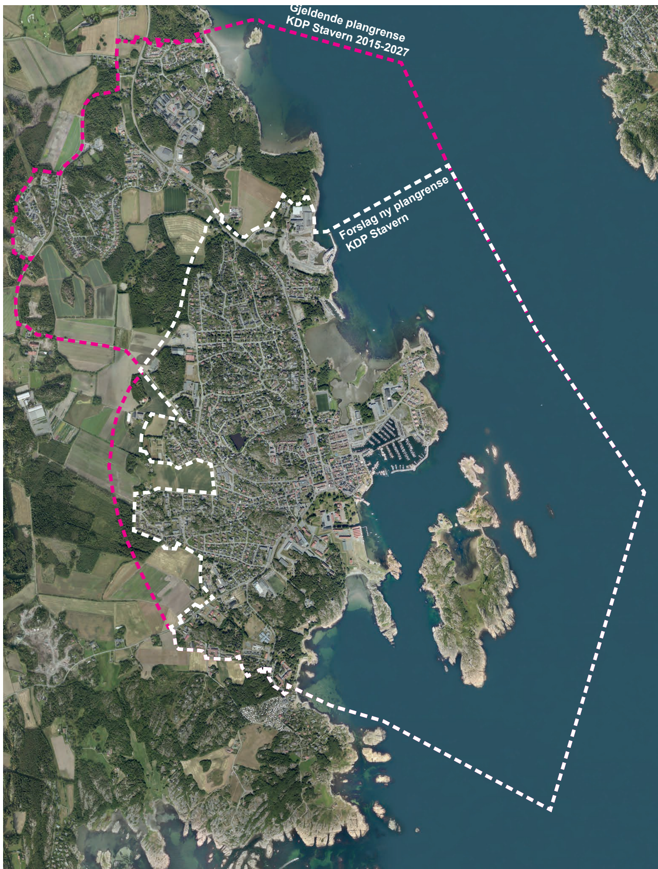
Kartet viser Rådmannens forslag til ny avgrensning av Kommunedelplan for Stavern by.