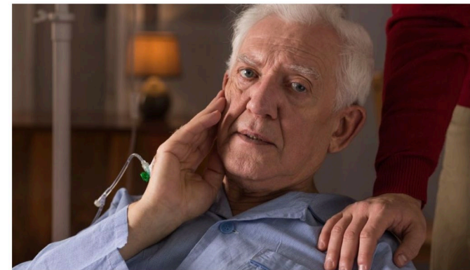
Mange med demens får depresjon og angst. Musikk gjør dem mindre deprimerte og reduserer angsten noe, ifølge flere studier på temaet.

Eldre er like interessert i musikk, mat, fellesskap og sjekking som yngre. Derfor er det helt på sin plass at pensjonister har fått sin egen festival – Voi voi-festivalen.