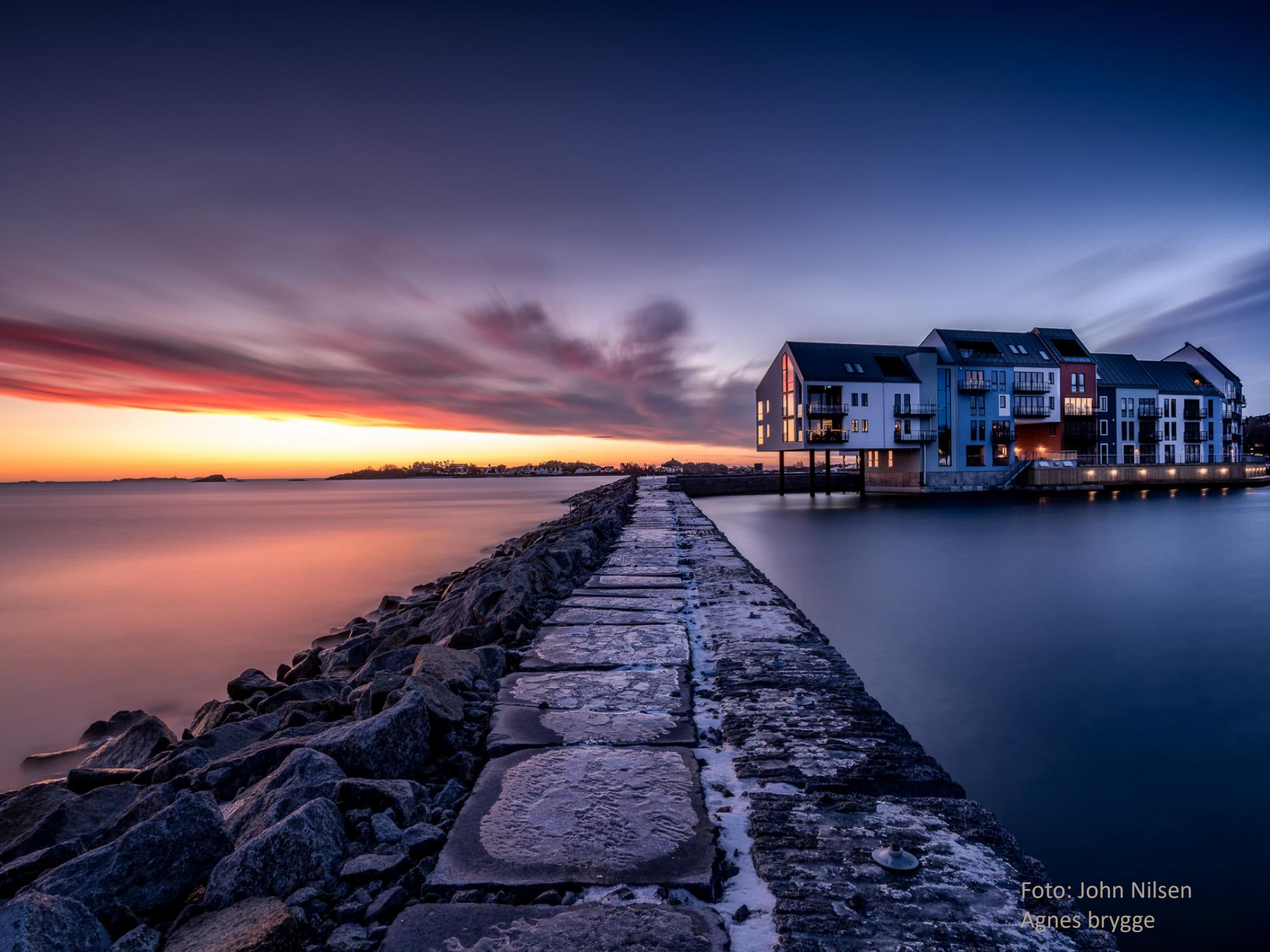
Agnes brygge