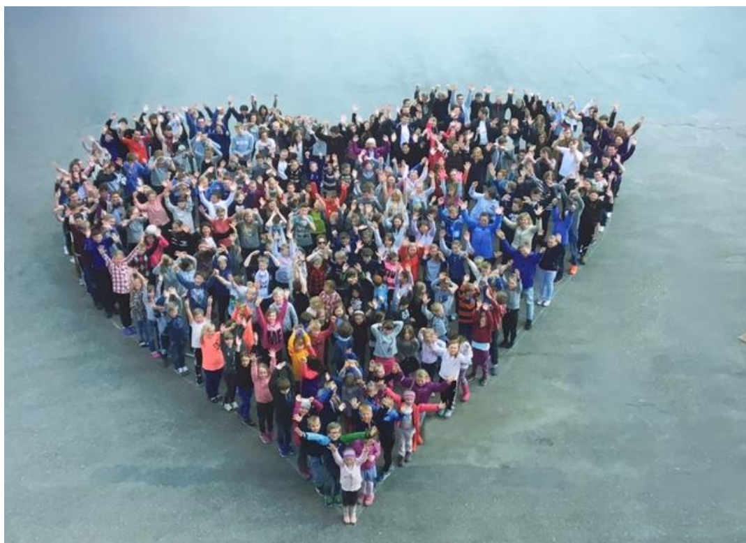
Foto: Kvelde skole VIS-dag mars 2016

I tillegg har ansatte en skjerpet aktivitetsplikt i saker der ansatte krenker elever jf. oppl. § 9A-5. Dersom en som jobber på skolen får mistanke om eller kjennskap til at en annen som arbeider på skolen utsetter en elev for krenkelser skal vedkommende straks varsle rektor. Rektor skal varsle skoleeier på skjema – Melding til skoleeier .