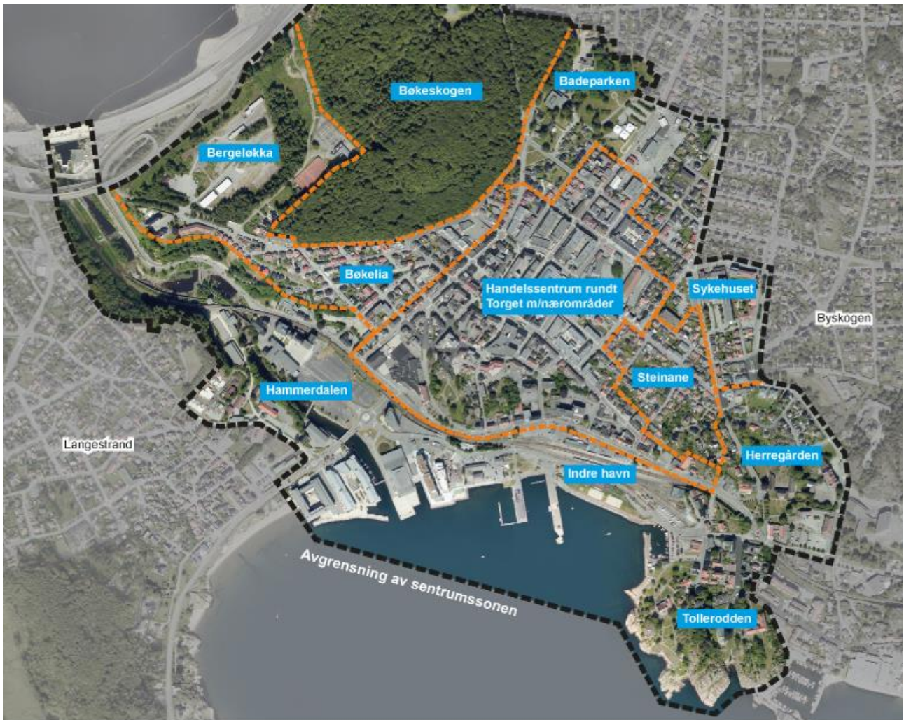
Kartutsnittet viser avgrensningen av sentrumssonen i Kommunedelplan for Larvik by. Dette omfatter også den historiske bykjernen.