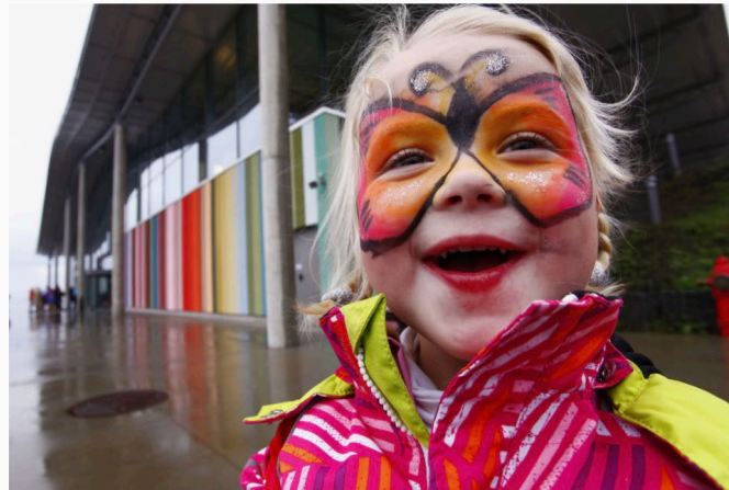
Kulturmatt i Larvik