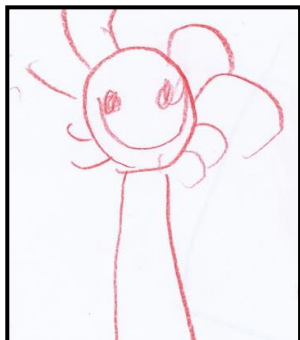
Ann Iren Holt Sundet Fagarbeider 100% stilling