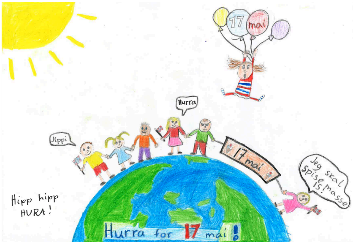
Tegnet av: Oda, 4b