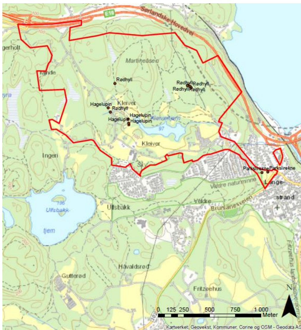
Figur 4: Lokalteter med svartelistearter som ble registrert i forbindelse med feltarbeidet.

Det ble registrert flere nye forekomster av svartelistede plantearter i planområdet (Figur 4).