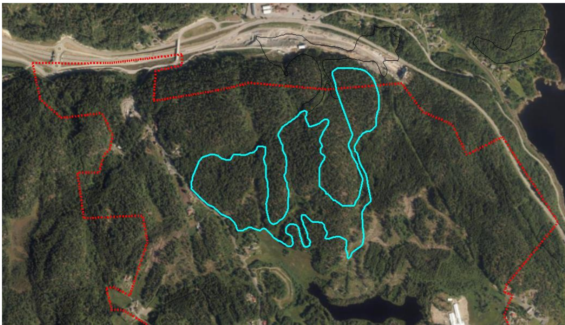
Figur 3: Registrert lokalitet med gammel barskog. Planavgrensningen er markert med rød stiplet linje.

Lokaliteten (Figur 3) er registrert i 2007 og det er utført hogst i enkelte arealer i etterkant av dette.