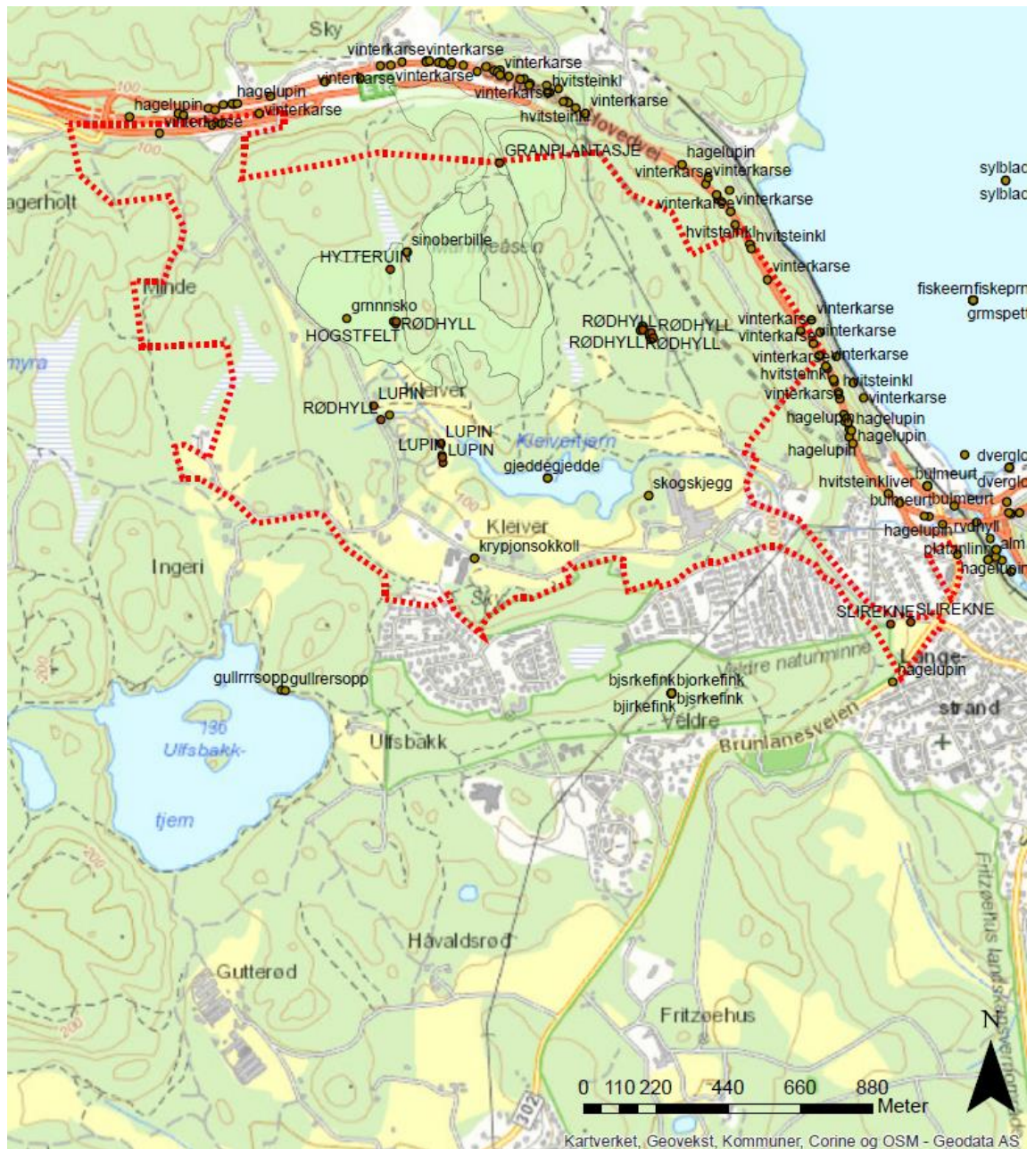
Figur 1: Registreringene fra feltarbeidet sammenstilt med registreringene som finnes i Naturbase. Planområdets avgrensning er markert med rød stiplet linje