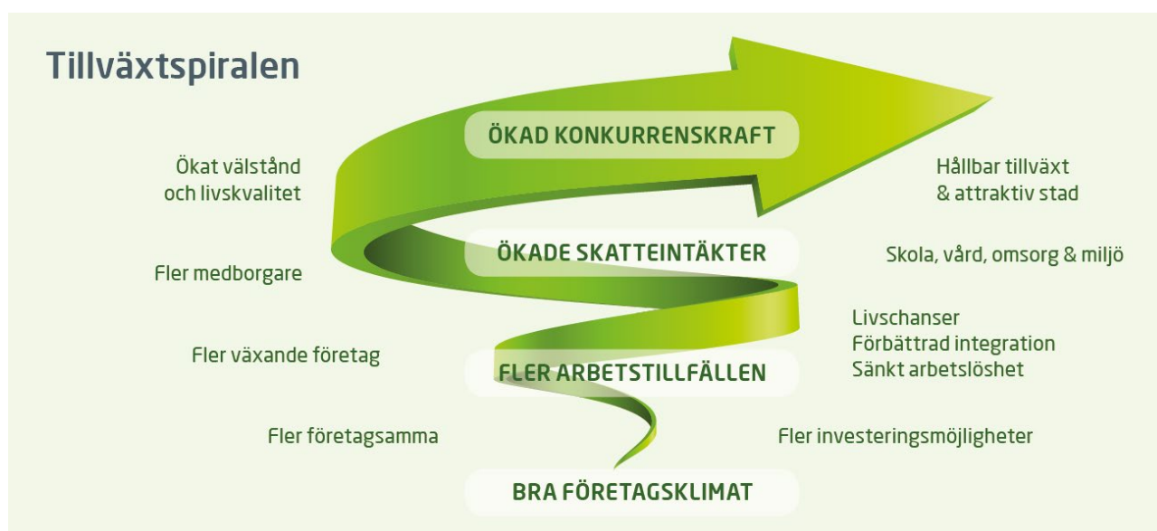
Figur 2 - Tillväxtspiralen

Alla nya medarbetare får redan under sin introduktionsutbildning en genomgång av varför företagsklimatet är viktigt för hela staden. Med hjälp av en bild de kallar "Tillväxtspiralen" förklarar ledningen hur næringslivsfrågorna är ett medel för att skapa en attraktiv plats för medborgarna. I nätverket "Service i samverkan" har staden samlat omkring 150 medarbetare som möter företag i vardagen. Alla som arbetar med tillstånd, tillsyn, entreprenadstyrning eller service ingår i nätverket. De har egna träffar och utbildningar för att ständigt bli bättre på att ge företagen rätt stöd och bemötande, både enskilt och tillsammans. Eller som Solna uttrycker det: Staden har 150 næringslivsutvecklare.»