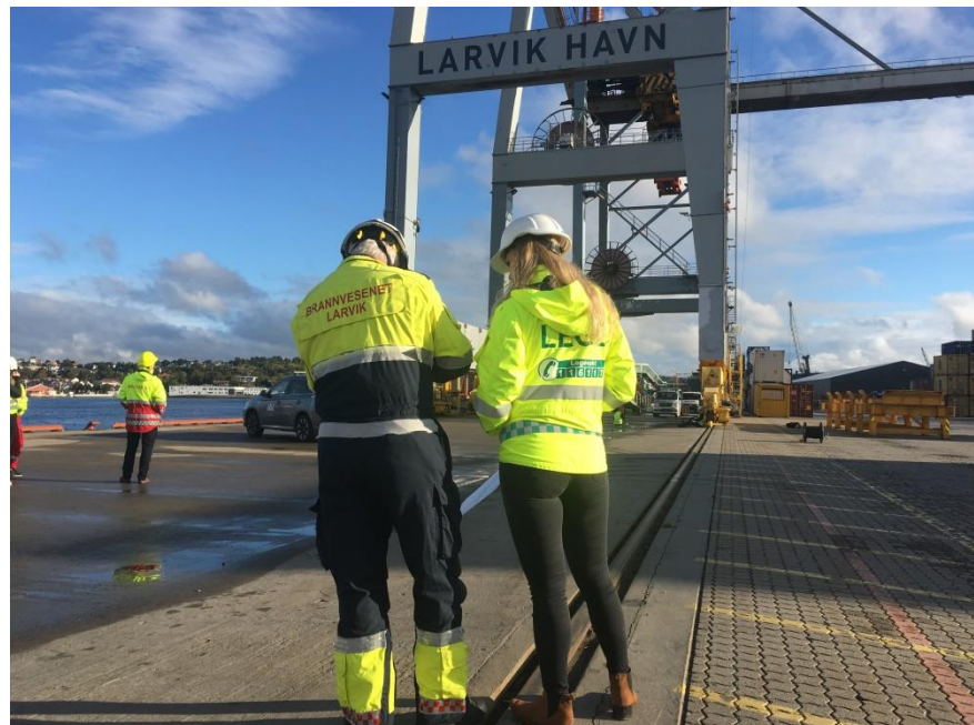
Fra øvelse på larvik havn 19.09.2017