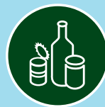
Glass- og metall- emballasje