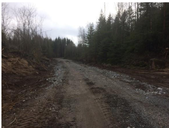
Nyetablert landbruksvei.