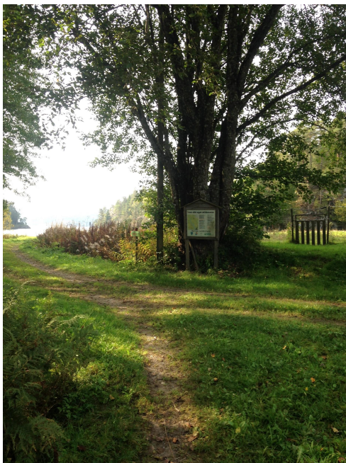
Merket tursti langs Farris i Larvik.

Søknadsfrist: Søknadene behandles fortløpende. Siste frist for å sende inn søknad er 15. november.