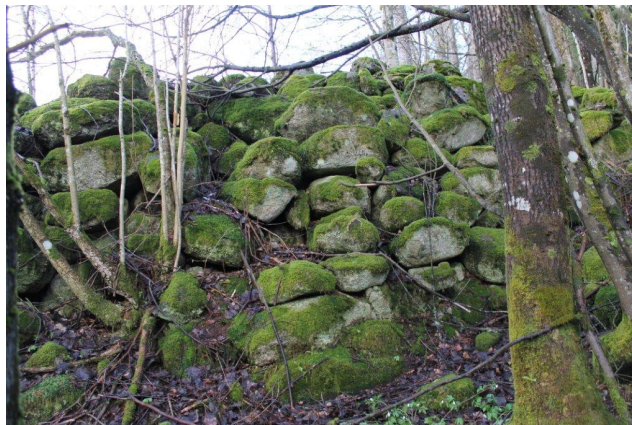
Steingjerder kan bli svært fine landskapselementer hvis de ryddes frem.

Tiltak kan støttes med inntil 50 % tilskudd av godkjent kostnadsoverslag. Dersom tiltaket kan støttes med andre tilskuddsmidler skal utmålingen av SMIL-tilskuddet vurderes i forhold til nytten av tiltaket og størrelsen på andre tilskudd. Tilskuddet kan gis til skjøtsel, istandsetting og vedlikehold. Årlig skjøtsel støttes gjennom RMP.