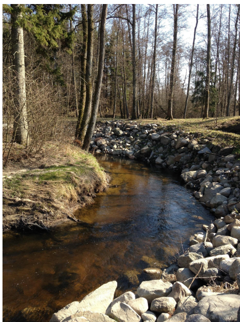
Steinsetting av elvekant for å hindre erosjon.