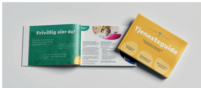
TJENESTEGUIDEN: Finnes i trykt og digital versjon.

Det er utarbeidet en tjeneste guide til innbyggerne som skal gjøre det lettere å finne fram til hvilke tjenester som finnes i kommunen, for hvem, og når de skal benyttes.